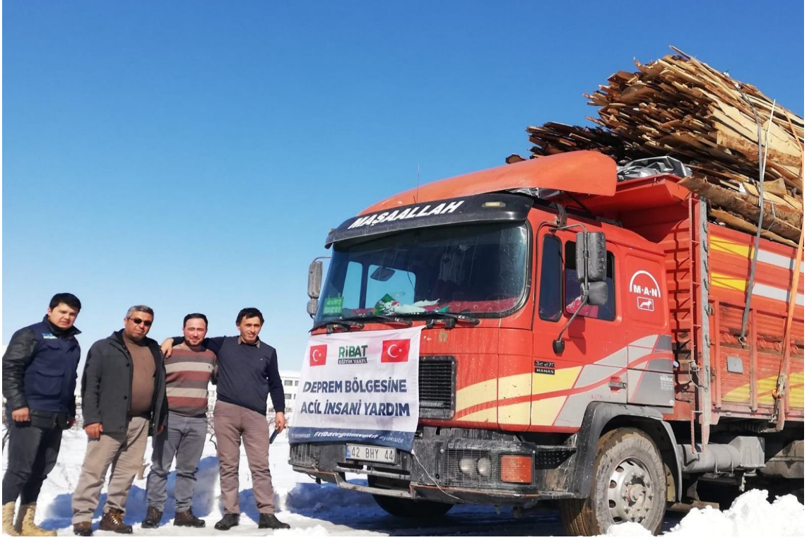
Görsel 19: Ribat Derneği Geçici Barınma İnşasında Kullanılacak Malzeme Desteği