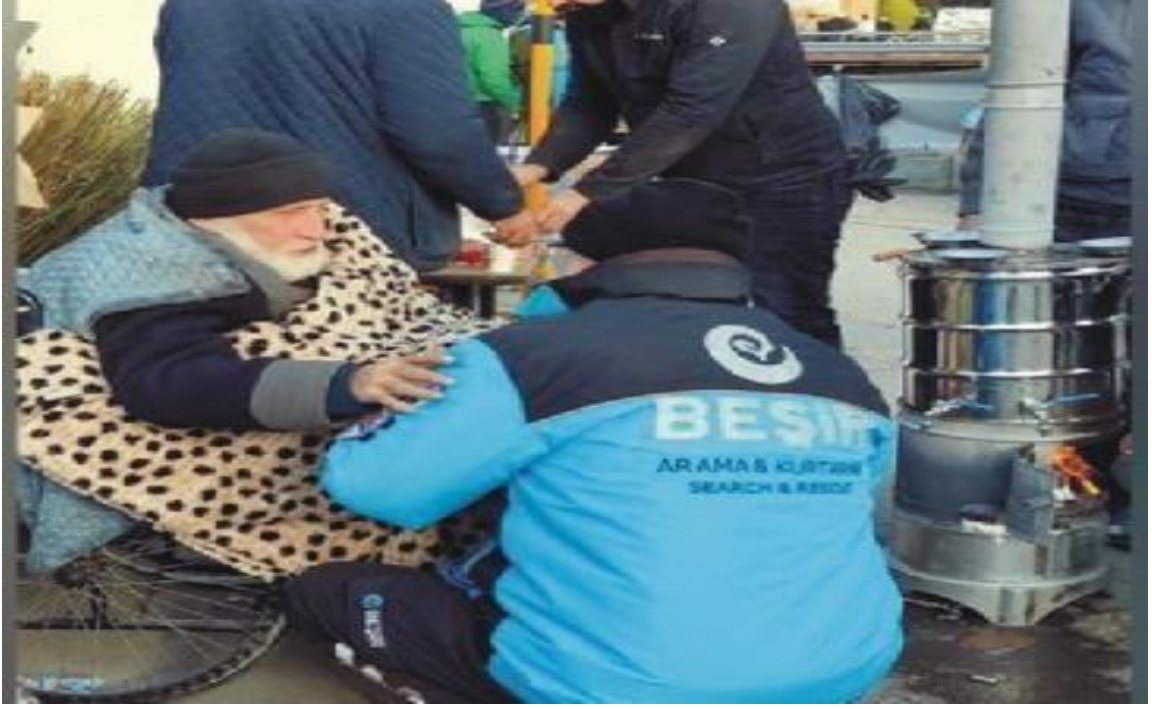
Görsel 11: Yaşlı Bir Depremzedeye Yardım Eli Uzatan Beşir Derneği Gönüllüsü