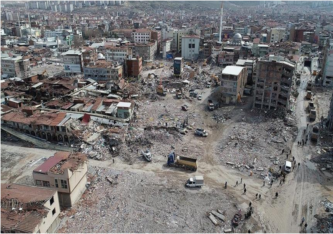
Görsel 6: Deprem Sonrası Malatya Şehir Merkezi