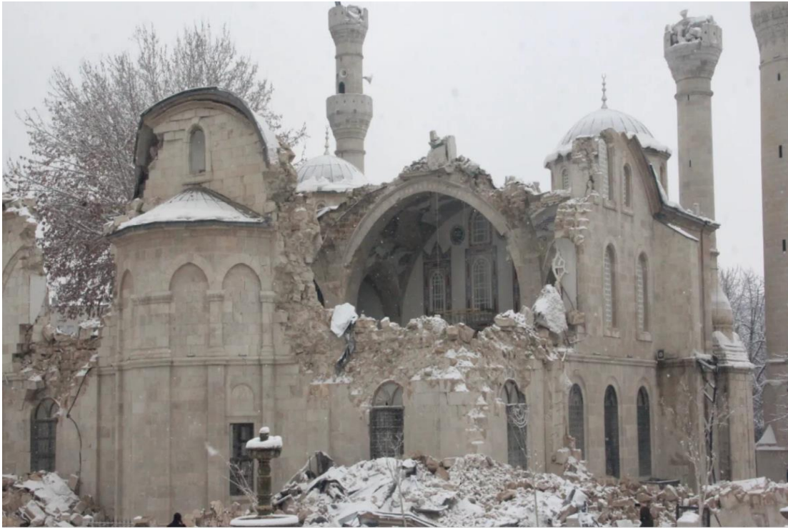
Görsel 4: Deprem Sonrası Malatya'nın Simgesi Yeni Cami