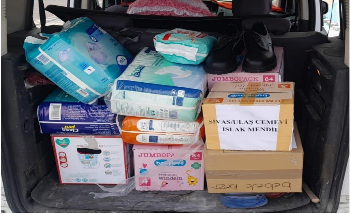
Görsel 13: Sivas Ulaş Cemevi'nin Gönderdiği Yardımlardan Bir Kare