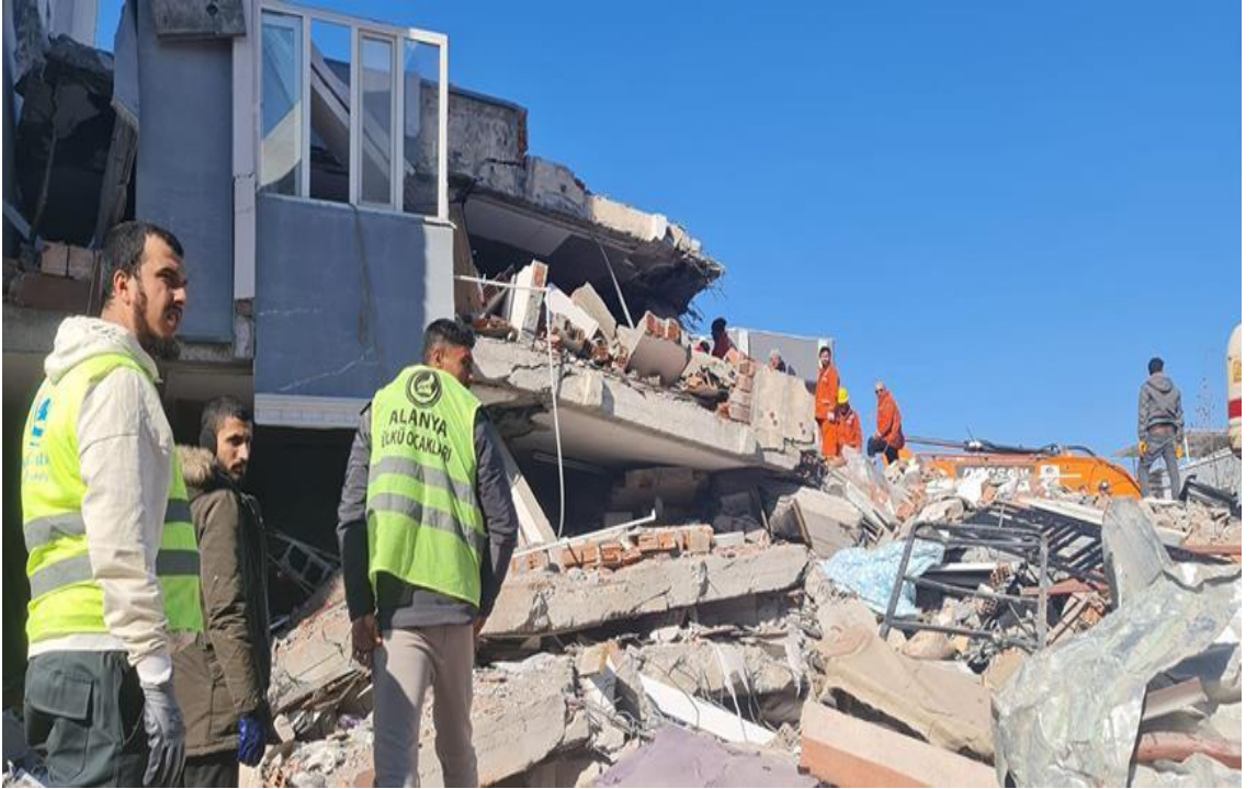
Görsel 10: Arama Kurtarma Çalışmalarına Katılan Ülkü Ocakları Gönüllüleri