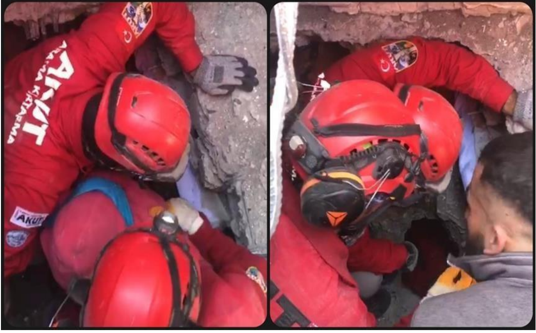
Görsel 7: Enkaz Altında Arama Kurtarma Çalışması Yapan AKUT Ekibi