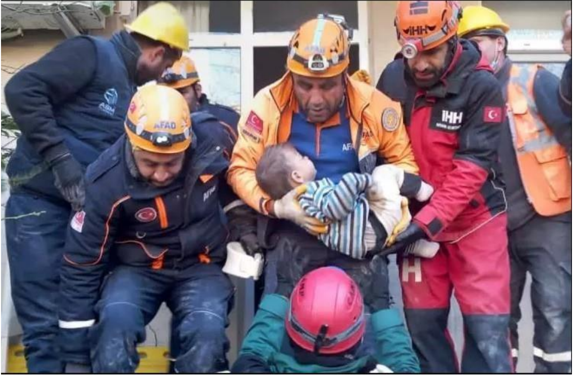
Görsel 9: Arama Kurtarma Çalışmasına Katılan Alan İHH Gönüllüsü