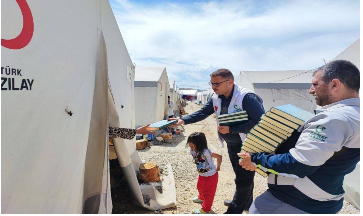
Görsel 23: Hayrat Vakfı'nın Kızılay Çadır Kentte Kur'an Dağıtım Faaliyeti