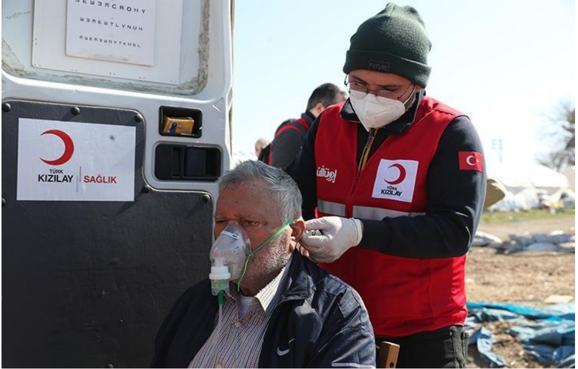
Görsel 22: Türk Kızılayı Mobil Sağlık Destek Aracı