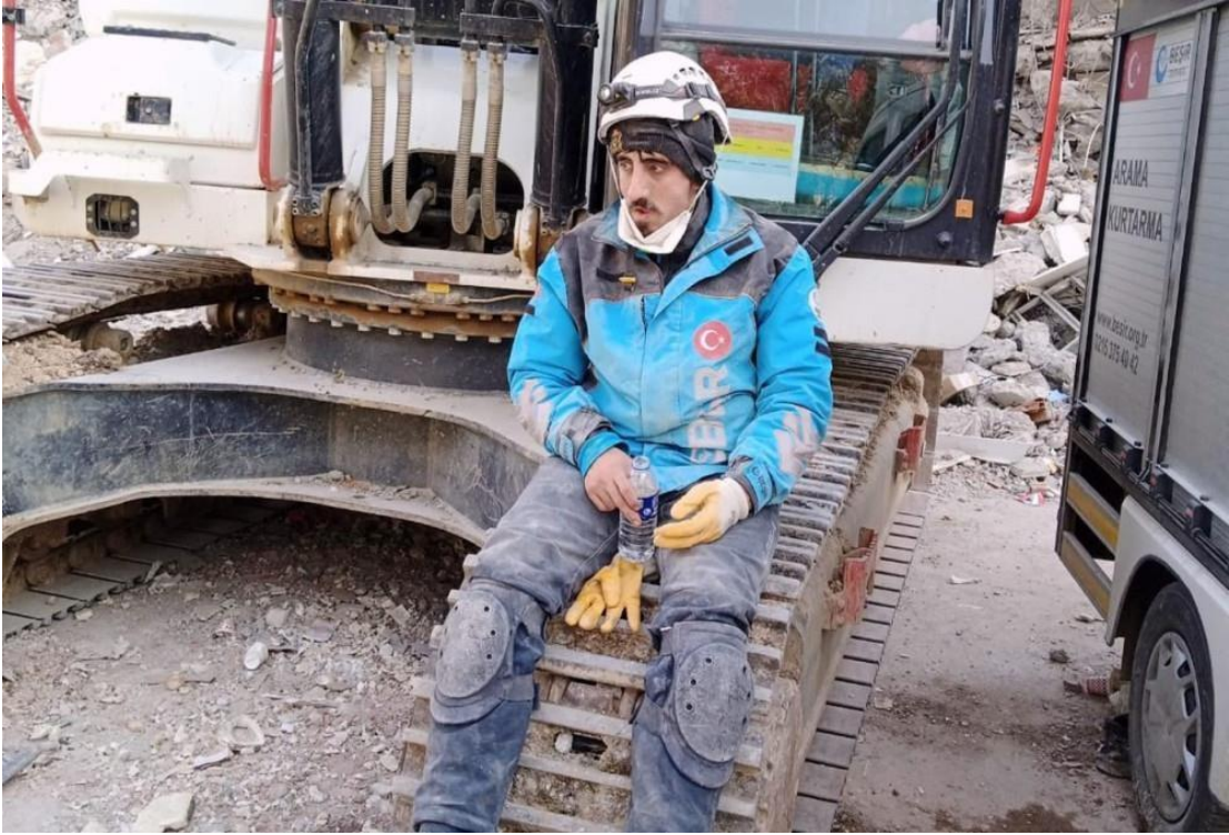
Görsel 8: Beşir Derneği Adına Arama Kurtarma Faaliyetine Katılan Kepçe Operatörü