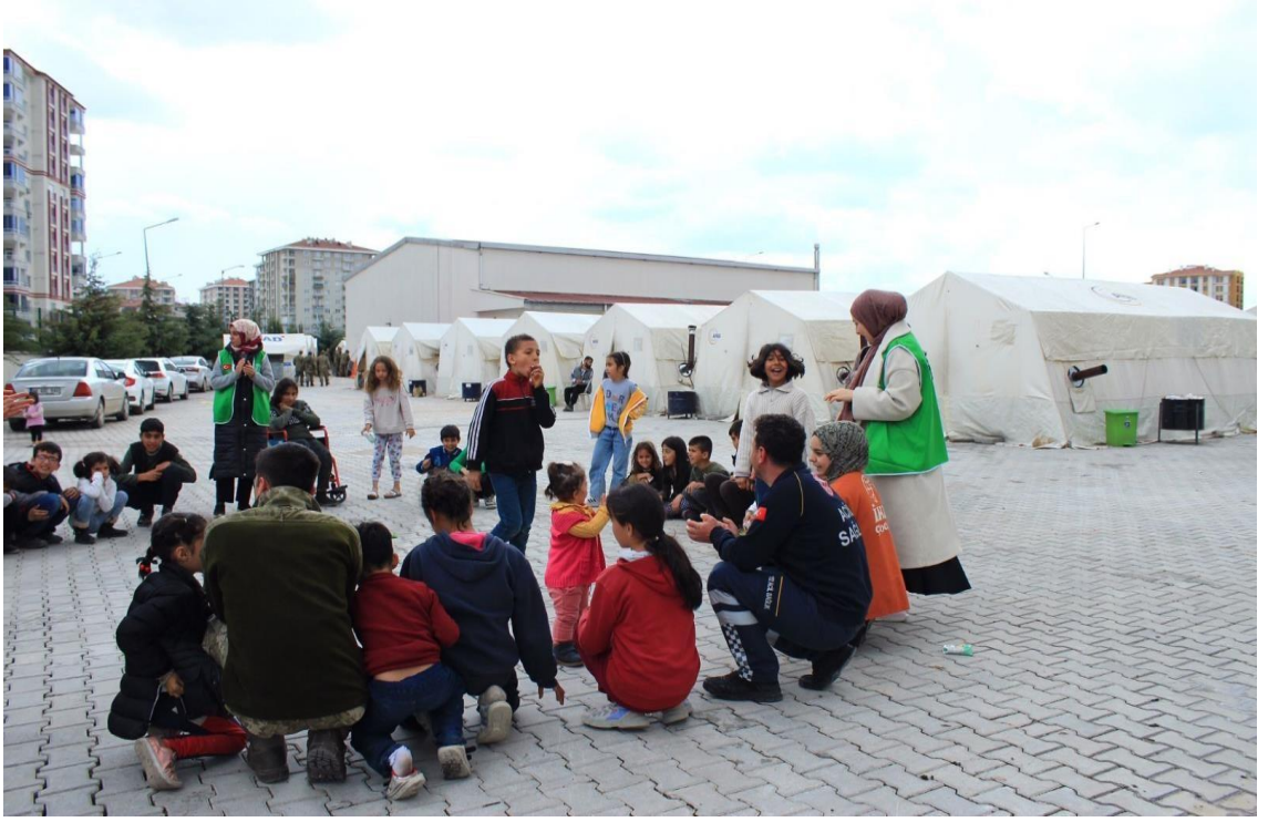
Görsel 24: İHH Çadır Kent Psikososyal Destek Çalışması