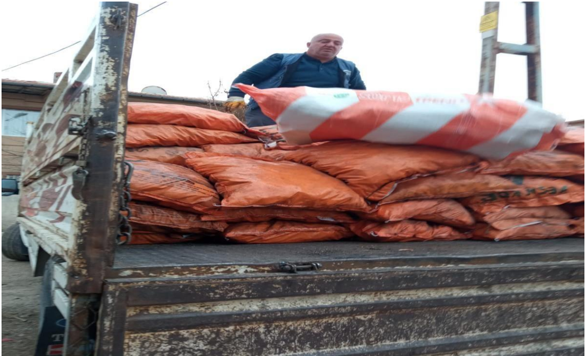
Görsel 20: Malatya Yetimler Kervanı Derneği Yakacak Dağıtımı