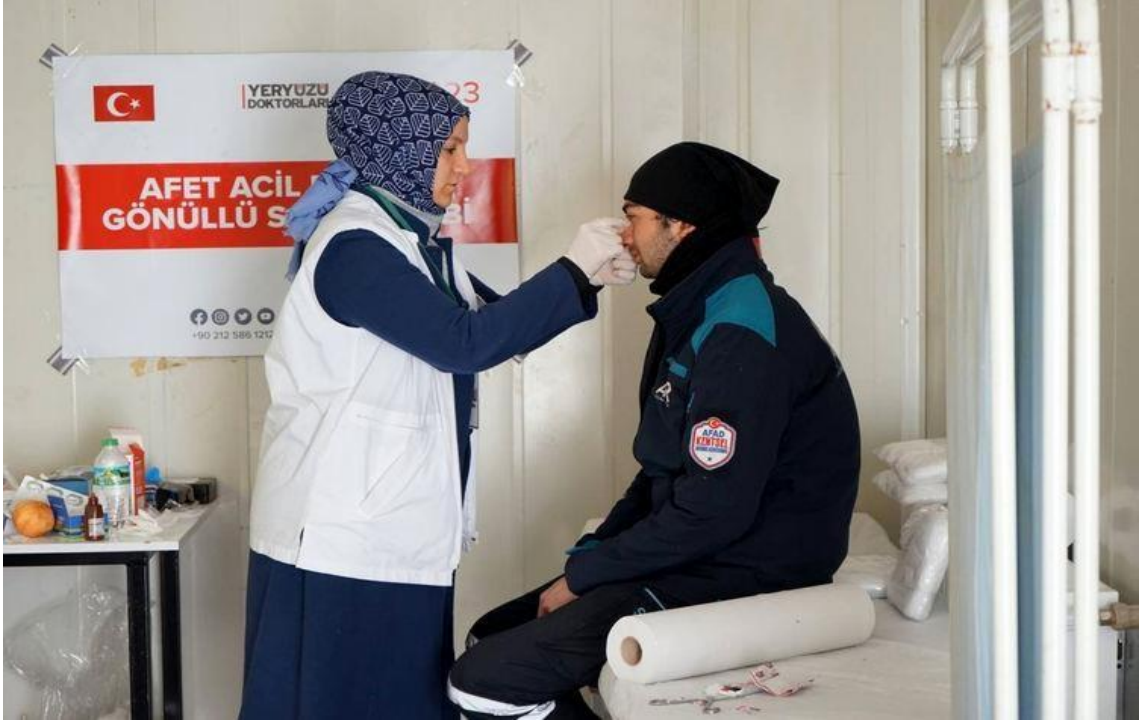
Görsel 21: Yeryüzü Doktorları Derneği Sağlık Desteği