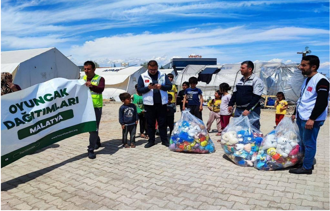
Görsel 25: Hayrat Vakfı Çadır Kent Oyuncak Dağıtımı