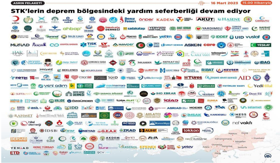
Görsel 1: Deprem Bölgesinde Faaliyet Yürüten Sivil Toplum Kuruluşları