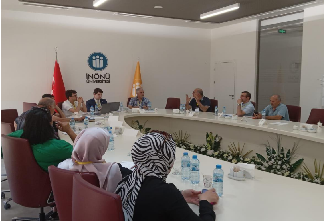
Görsel 30: Çalıştay Barınma Masası