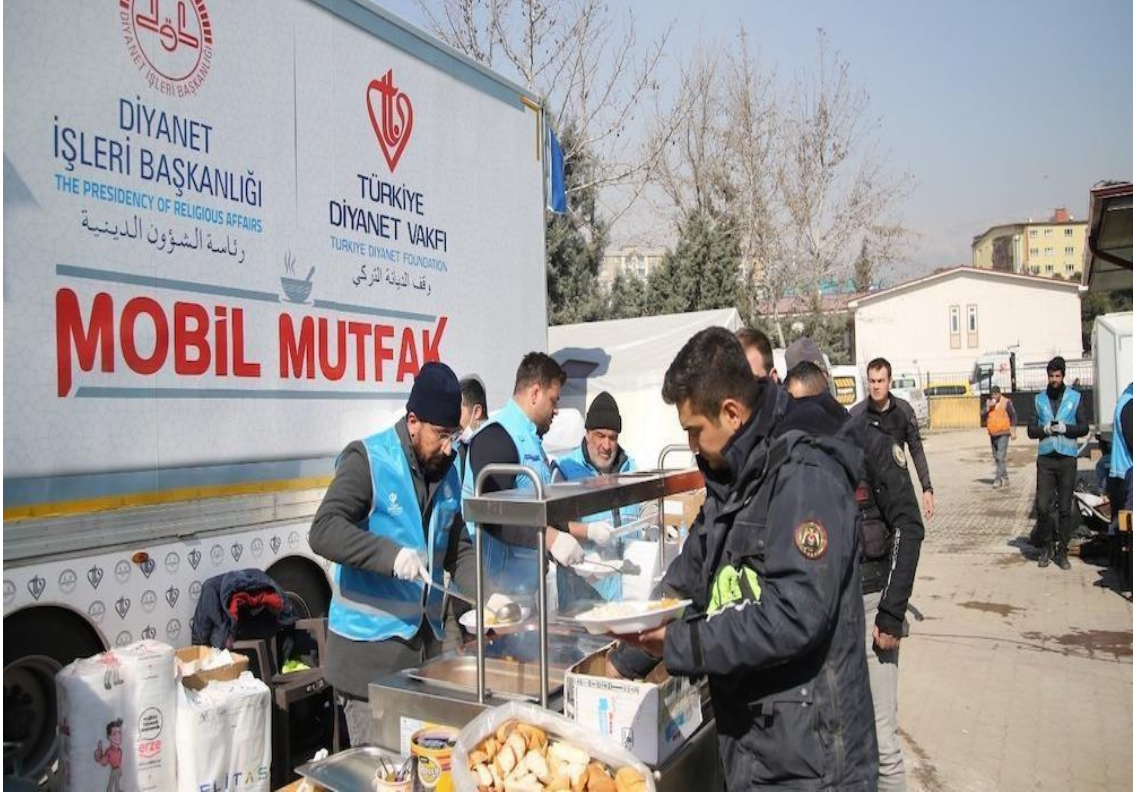
Görsel 15: Türkiye Diyanet Vakfı'nın Mobil Mutfağı