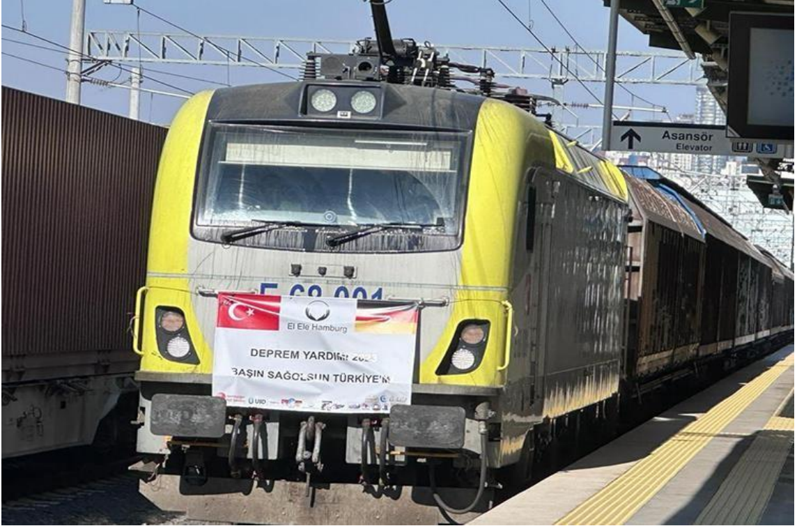
Görsel 12: Yurt Dışından Yardım Gönderen El Ele Derneği