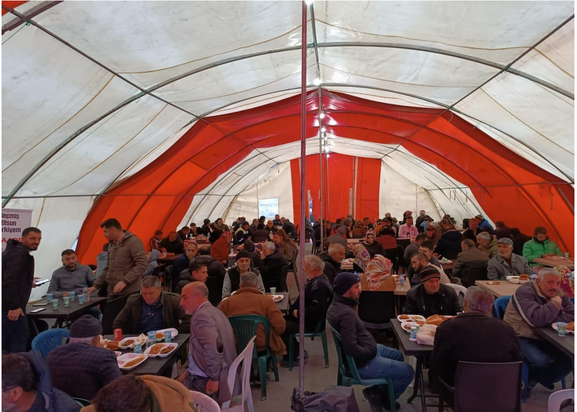
Görsel 14: Cansuyu Derneği'nin Eski Otogarda Kurduğu Yemek Çadırı