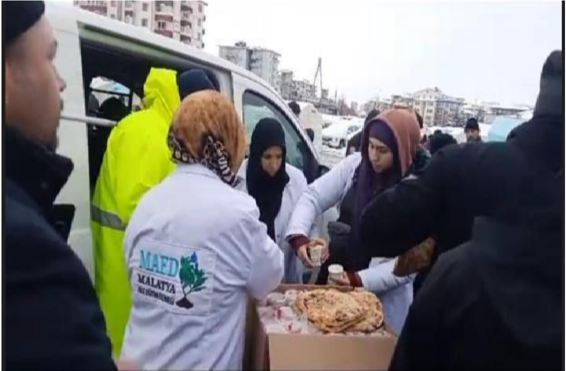
Görsel 16: Malatya Aile ve Eğitim Derneği Çorba Dağıtımı