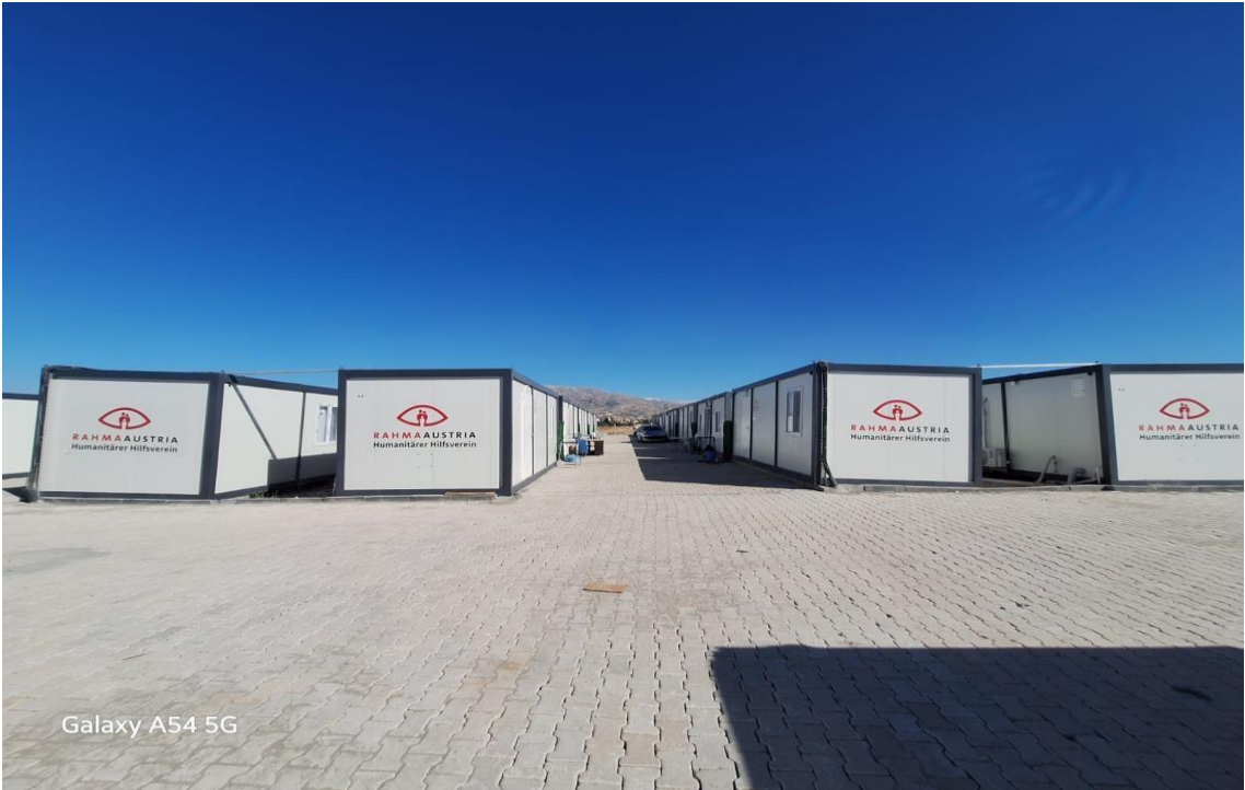
Görsel 18: Avusturya Merkezli Rahma Derneği'nin Malatya'da Kurduğu Konteyner Kent