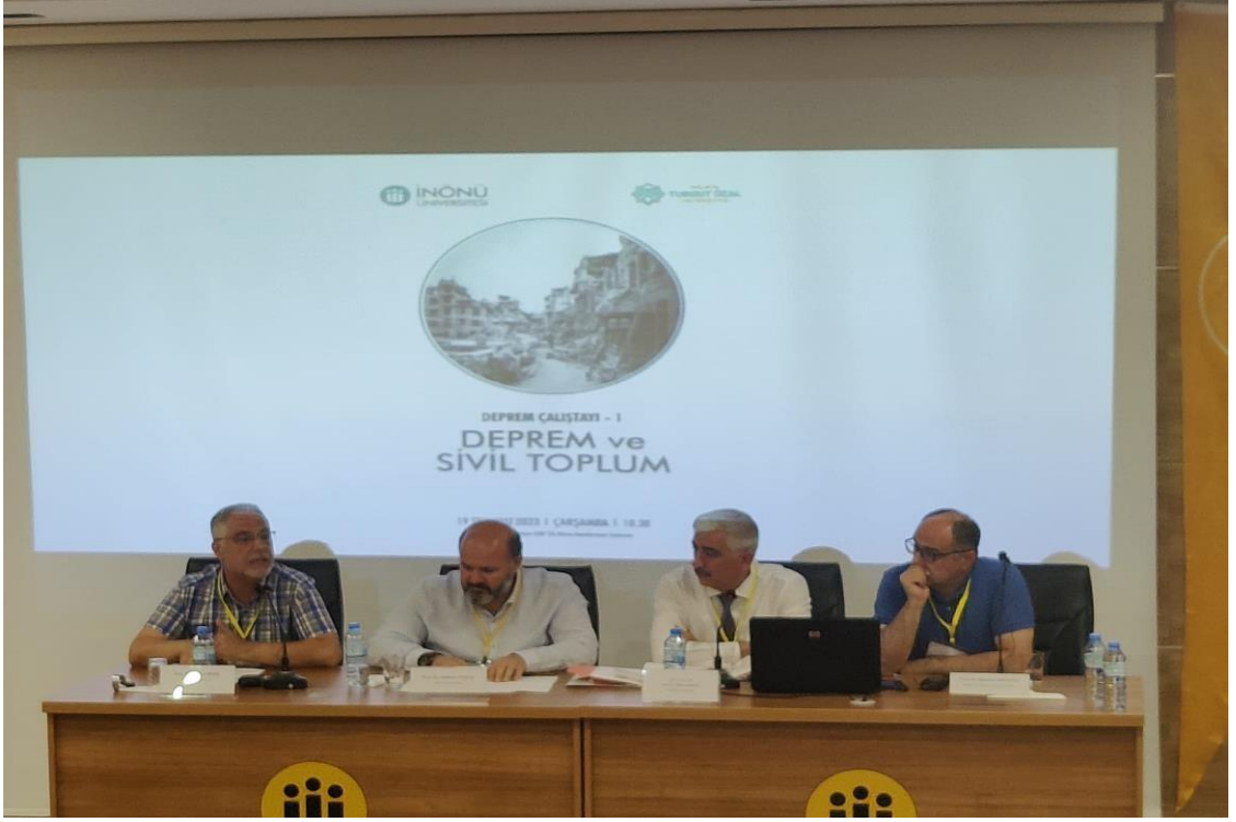
Görsel 27: Deprem ve Sivil Toplum Çalıştayı Açılış Paneli