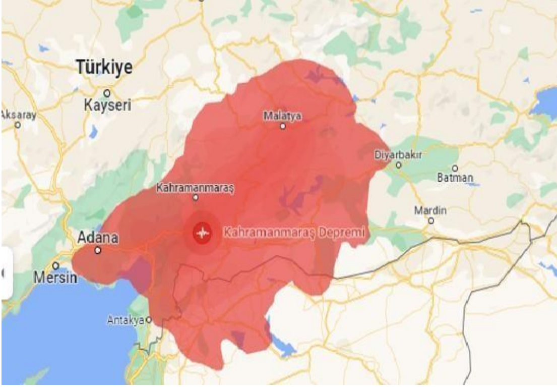
Görsel 3: 6 Şubat 2023 Depremlerinden Etkilenen Bölge