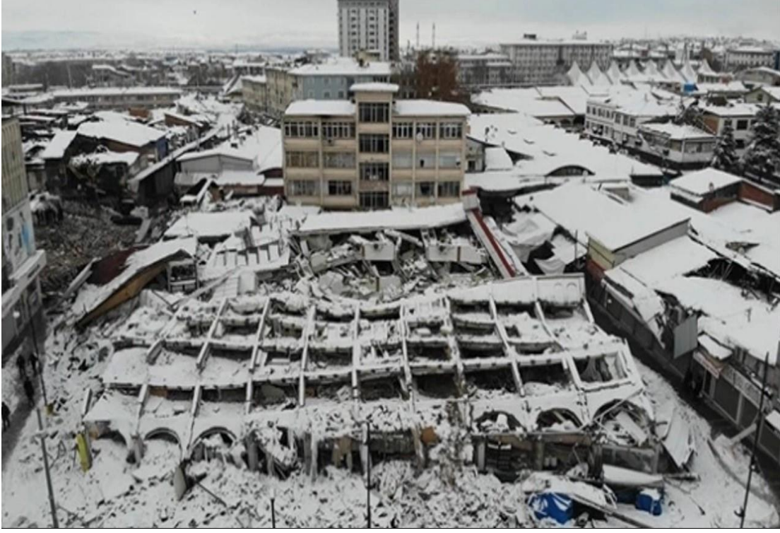
Görsel 5: Deprem Sonrası Malatya Şire Pazarı