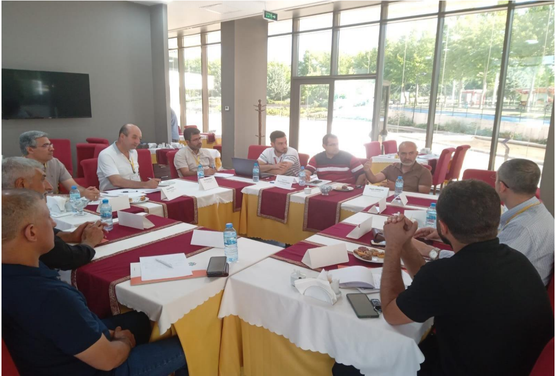
Görsel 28: Çalıştay Arama Kurtarma, Güvenlik Tahliye Masası