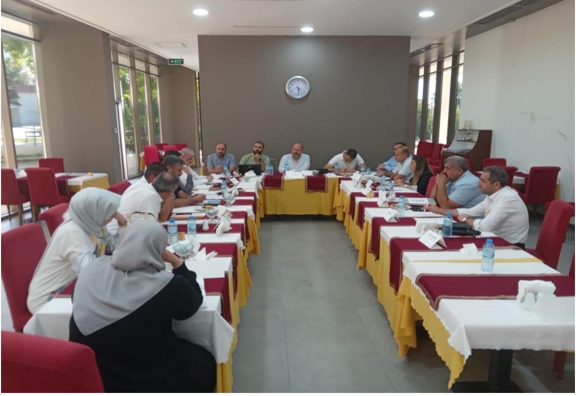
Görsel 29: Çalıştay Yemek, Giysi ve Hijyen Masası