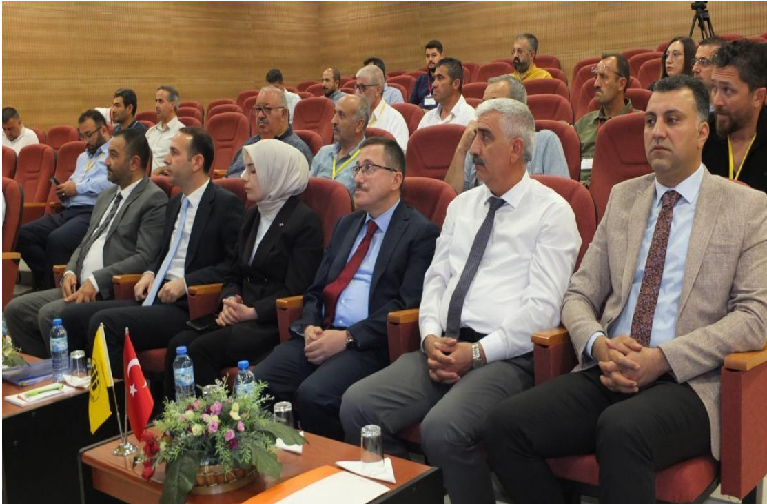
Görsel 26: Deprem ve Sivil Toplum Çalıştayı Açılış Programı