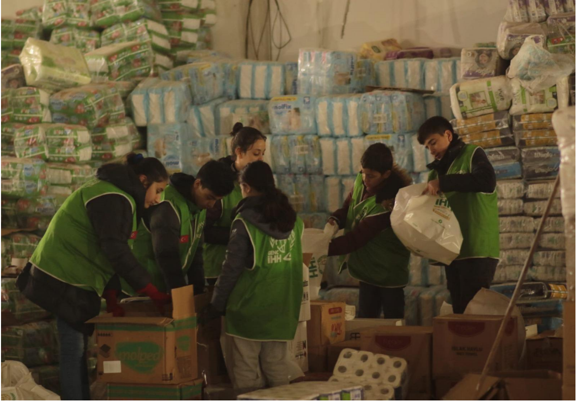
Görsel 17: İHH Malatya Yardım Deposu