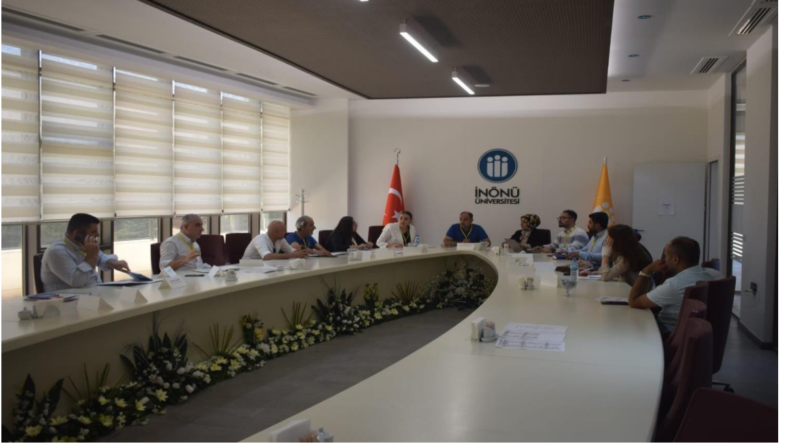
Görsel 31: Çalıştay Eğitim ve Psiko Destek Masası